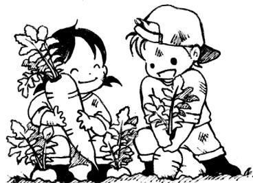
(表裏イラスト:辻佳奈)